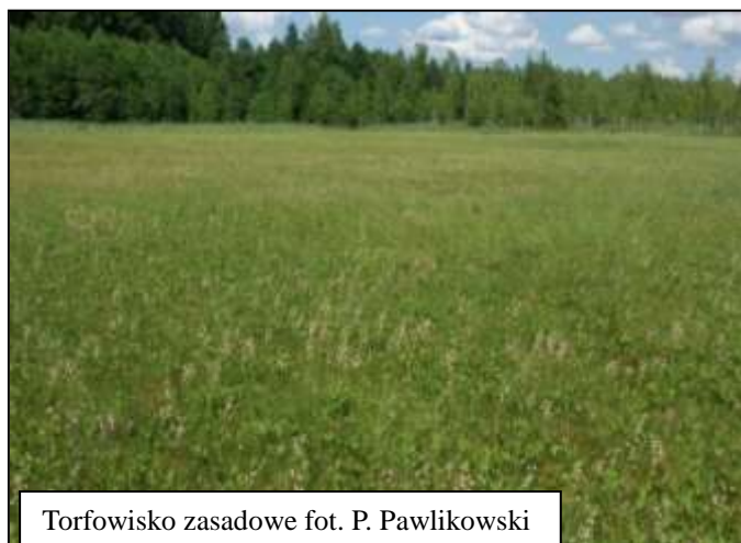
Torfowisko zasadowe fot. P. Pawlikowski

Siedlisko obejmuje minerogeniczne torfowiska niskie zasilane wodami podziemnymi, wykształcające się najczęściej w strefie brzeżnej dolin rzecznych lub mis jeziornych w miejscach wypływu, wyseku wód podziemnych lub zakładające się na żyznych osadach jeziornych bogatych w węglan wapnia. Wykazuje duże zróżnicowanie pod względem definiujących je zbiorowisk roślinnych. Bardzo ważną rolę fito cenotwórczą i diagnostyczną pełnią liczne gatunki mchów brunatnych.