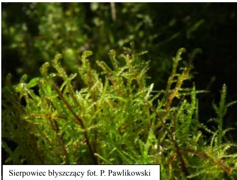
Sierpowiec błyszczący

Sierpowiec błyszczący tworzy jasno- lub żółtozielone, czasami brązowo lub czerwono nabiegłe, nieco błyszczące (w stanie suchym - matowe) darnie. Gametofit: łodyżki 6-10 cm lub dłuższe, sztywne, mniej więcej pierzasto rozgałęzione. Sporofit: do 4 cm długości, czerwony. Puszka około 2 mm długości żółtoczerwona, horyzontalnie ustawiona. Sierpowiec jest gatunkiem światłolubnym, występującym prawie wyłącznie w zbiorowiskach z klasy Scheuchzerio-Caricetea nigrae .