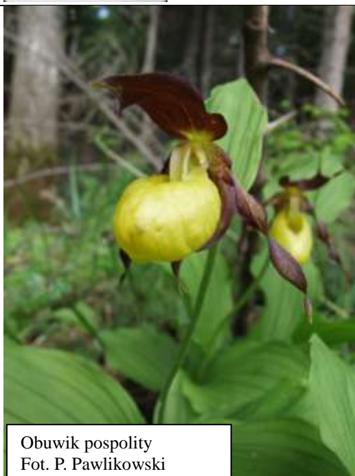
Obuwik pospolity

ocenę właściwą FV, osiem ocenę niezadowalającą U1, a siedem ocenę złą U2.