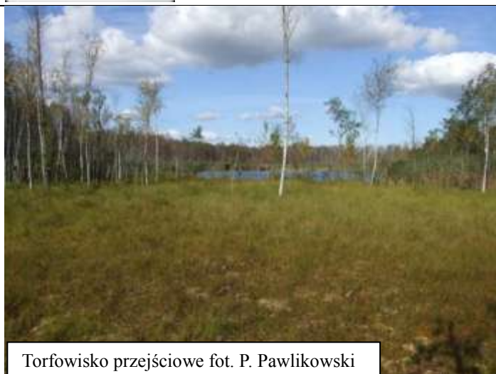
Torfowisko przejściowe

Stan zachowania w sieci Natura 2000 – (na podstawie wyników monitoringu typów siedlisk przyrodniczych z 2010 i 2011 roku)