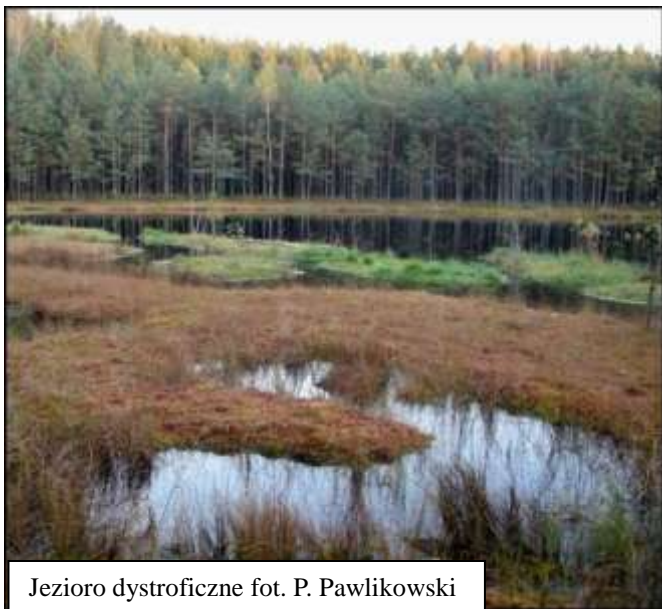
Jezioro dystroficzne

Zagrożenia siedliska – eutrofizacja spowodowana spływem związków organicznych i mineralnych (spływy nawozów z pól i ścieków bytowych, zabudowa i przekształcanie brzegów).