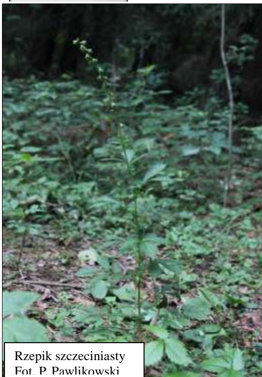
Rzepik szczeciniasty

Rzepik szczeciniasty występuje na przydrożach i okrajkach grądów i łęgów, rzadziej olsów i borów mieszanych, głównie na siedliskach lasowych, zwłaszcza dobrze uwilgotnionych, wchodząc w skład zbiorowisk okrajkowych. Nigdy nie jest spotykany pod okapem drzewostanu, w typowych zbiorowiskach leśnych. Nie występuje jednak także poza lasami.