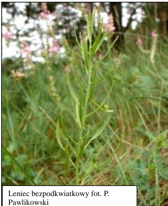
Leniec bezpodkwiatkowy