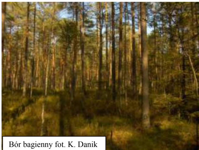
Bór bagienny

Zagrożenia siedliska – niszczenie runa podczas zrywki drewna, gatunki inwazyjne, szkody wyrządzane przez zwierzyne (kopytne), pinetyzacja.