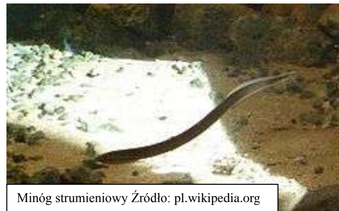
Minóg strumieniowy

Minóg strumieniowy należy do gatunku ryb bezszczękowych. Ciało jest wydłużone, robakowatego kształtu. Długość dorosłych osobników wynosi 120 – 185 mm. Grzbiet i górna część boków są niebieskawoszare, o metalicznym połysku. Boki są jaśniejsze, a brzuch białawy. Płetwy żółtobrązowe z niewielką ilością pigmentu. Tarło rozpoczyna się pod koniec kwietnia i trwa do połowy maja. Samice składają ikrę do dołków o średnicy 15 – 20 cm i głębokości 5 – 10 cm. Rozwój embrionalny trwa 11 – 14 dni. Larwy po opuszczeniu gniazda wyszukują piaszczysto-humusowe nanosy, gdzie po zagrzebaniu przebywają 3 – 6 lat.