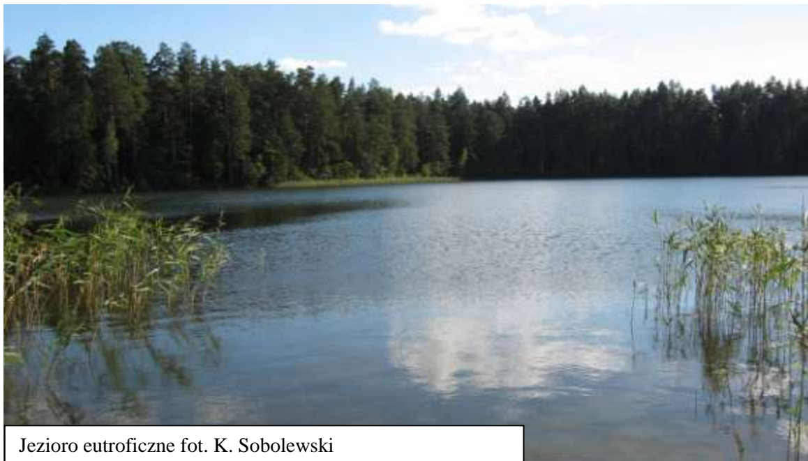
Jezioro eutroficzne

Są to naturalne jeziora i stałe niewielkie zbiorniki wodne oraz odcięte fragmenty koryt rzecznych z wolno pływającymi w toni wodnej makrofitami ( Potamion i częściowo Nymphaeion ), makrofitami zakorzenionymi w dnie o liściach pływających, a także prymitywnymi skupieniami drobnych roślin pływających po powierzchni wody ( Lemnetea ). Pod względem hydrologicznym wykazują duże zróżnicowanie. Zasilane w wodę mogą być ze źródeł powierzchniowych (opad atmosferyczny, spływ powierzchniowy, dopływy rzeczne) lub źródeł podziemnych – dopływ gruntowy. Najbliższe