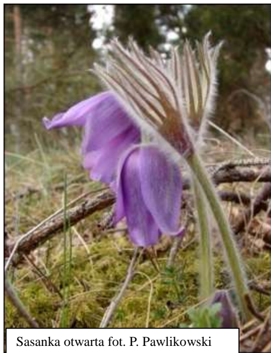
Sasanka otwarta

Stan zachowania w sieci Natura 2000 – W latach 2009-2011 monitoring w regionie kontynentalnym objął 34 populacje sasanki otwartej