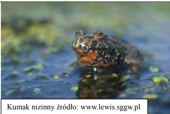
Kumak nizinny

W Polsce występuje na całym niżu. Jest pospolity, nigdzie jednak nie występuje w dużych skupiskach. Granica jego pionowego zasięgu wynosi 400 m n.p.m. Odżywia się głównie larwami i postaciami dorosłymi owadów wodnych, pająków i skorupiaków. Jesienią, gdy temperatura wody spadnie poniżej ok. 10°C, kumaki opuszczają zbiorniki wodne i wychodzą na ląd w poszukiwaniu miejsca na zimowanie. W Polsce objęty ścisłą ochroną gatunkową.