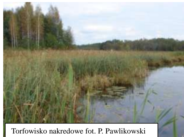
Torfowisko nakredowe

Torfowiska nakredowe z roślinnością typu szuwarowego wykształciły się i nadal powstają w toku naturalnej sukcesji zachodzącej w strefie litoralu zbiorników wodnych oraz na miejscu całkowicie lub częściowo zładowionych jezior z pokładem kredy jeziornej, pokrytej