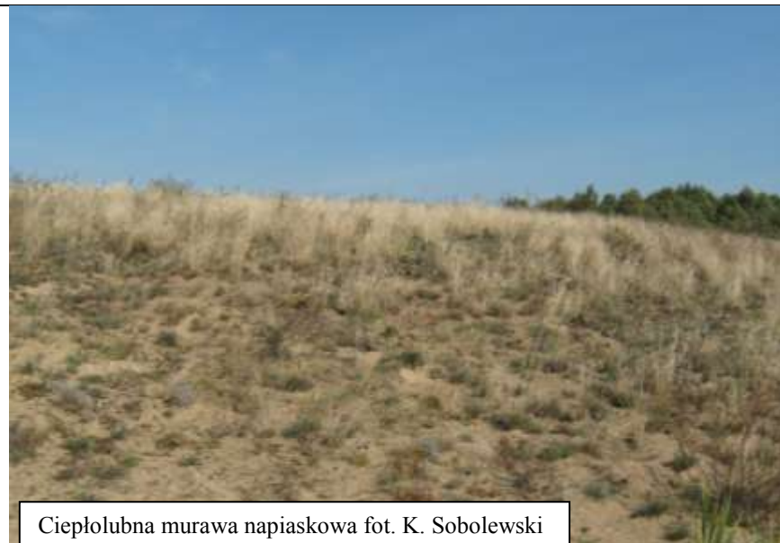
Ciepłolubna murawa napiaskowa

Zagrożenia siedliska – głównym zagrożeniem dla siedliska jest sukcesja wtórna. Utrzymanie tych siedlisk wymaga podjęcia zabiegów ochrony czynnej polegającej na usuwaniu drzew i krzewów, koszeniu oraz kontrolowanym wypalaniu.