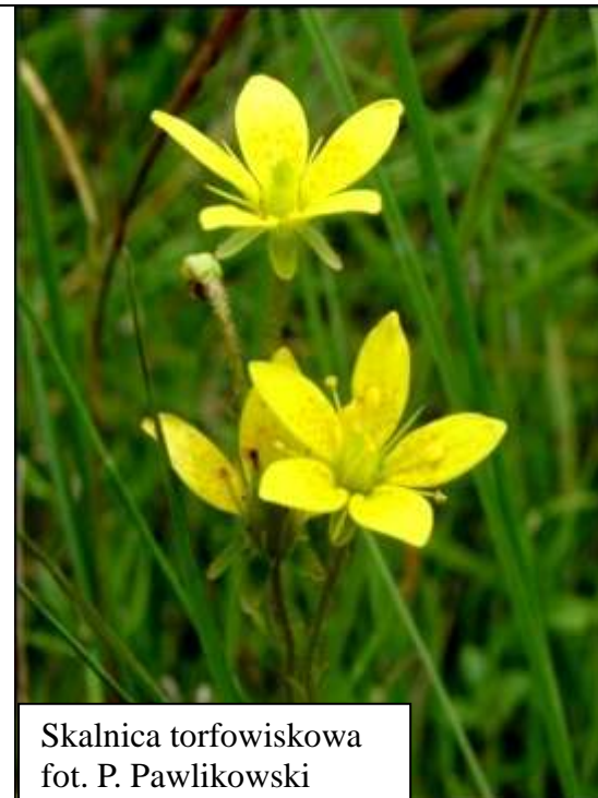
Skalnica torfowiskowa

Obuwik pospolity jest rośliną kłączową osiągającą wysokość do 50 cm. Z kłącza o średnicy 5 – 10 mm wyrasta prosty, szorstko owłosiony zielony pęd. Liście podobnie jak pęd są krótko owłosione, a ich liczba waha się o 2 do 5. Mają kształt jajowaty do szeroko lancetowatego, są ostro zakończone, często na krawędziach fałdowane. Okazałe intensywnie pachnące kwiaty wyrastają na szczycie pędu, zwykle pojedynczo, rzadziej po dwa lub trzy. Trzewikowata warzka, o krawędziach podwiniętych do wnętrza ma 20 – 30 mm długości, 15-20 mm szerokości. Jej barwa jest cytrynowożółta, rzadko zielonawożółta lub biała. Działki okwiatu mają barwę czerwono-brunatną, jedynie u nasady są zielone, wewnątrz gładkie, na zewnątrz owłosione. Owocem jest beczułkowatocylintryczna torebka o długości do 30 mm, także nieco łukowato wygięta.