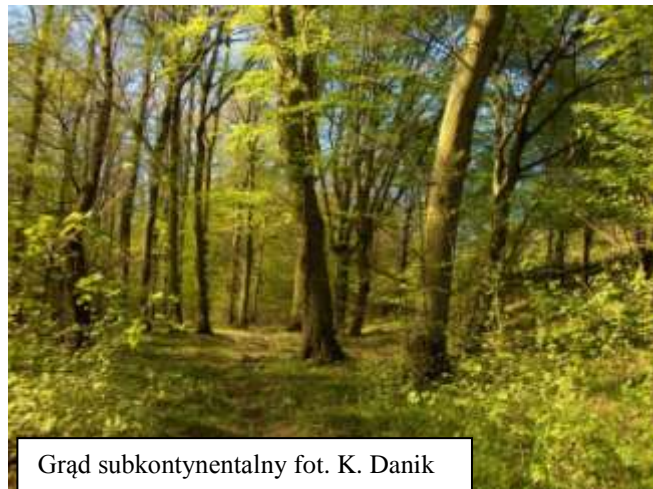
Grąd subkontynentalny

Grąd subkontynentalny w Europie Wschodniej reprezentuje grupę lasów dębowo - grabowych. W Polsce występuje na obszarach znajdujących się pod wpływem klimatu umiarkowanie kontynentalnego i osiąga zachodnią granicę zasięgu geograficznego. Siedliska tego zbiorowiska na terenach nizinnych są szeroko rozpowszechnione na wysoczyznach i równinach morenowych oraz na równinach peryglacialnych, w warunkach podłoża zbudowanego z glin zwałowych, piasków akumulacji lodowcowej oraz z piasków rzecznych tarasów akumulacyjnych i niektórych utworów sandrowych oraz aluwialnych. Ogromnej różnorodności podłoża geologicznego oraz właściwości hydrologicznych siedlisk grądowych odpowiada bardzo szeroka skala zmienności gleb. W typologicznej klasyfikacji siedlisk leśnych odpowiednikami grądu subkontynentalnego są: las mieszany świeży, las mieszany wilgotny, las świeży i las wilgotny. Grąd subkontynentalny jest zbiorowiskiem o złożonej, wielopiętrowej strukturze, w którym drzewostan składa się zwykle z 3 lub 4 warstw i zbudowany jest najczęściej z dębu szypułkowego Quercus robur , graba zwyczajnego Carpinus betulus , lipy drobnolistnej Tilia cordata i klonu pospolitego Acer platanoides . Ponadto w drzewostanie występują: dąb bezszypułkowy Quercus petraea , brzoza brodawkowata Betula pendula , osika Populus tremula , sosna zwyczajna Pinus sylvestris , a na siedliskach wilgotnych również jesion wyniosły Fraxinus excelsior , olsza czarna Alnus