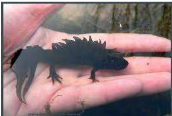
Traszka grzebieniasta

Płaz z rzędu płazów ogoniastych. Traszki grzebieniaste mają głowę zaokrągloną, tułów lekko grzbieto-brzusznie spłaszczony, ogon spłaszczony boczenie, z reguły krótszy od tułowia i zakończony ostro. Dorosłe traszki grzebieniaste są dwukrotnie dłuższe od pozostałych krajowych traszek. Przeciętna długość samca mieści się w 11 – 12 cm. Grzbietowa oraz boczna powierzchnia ciała pokryta jest licznymi brodawkami. Skóra brzusznej powierzchni ciała jest gładka. Brodawki znajdujące się na grzbiecie i po bokach ciała traszek grzebieniastych sprawiają, że skóra w dotyku jest chropowata, a nie gładka jak u innych gatunków rodzimych traszek. Brzuszna powierzchnia tułowia jest jaskrawo żółta lub pomarańczowa, pokryta czarnymi plamami o rozmaitej wielkości i nieregularnym kształcie. Traszka grzebieniasta jest typowym gatunkiem ziemnowodnym,