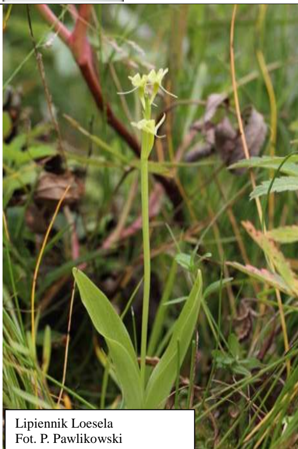
Lipiennik Loesela

otrzymało ocenę niezadowalającą lub złą.