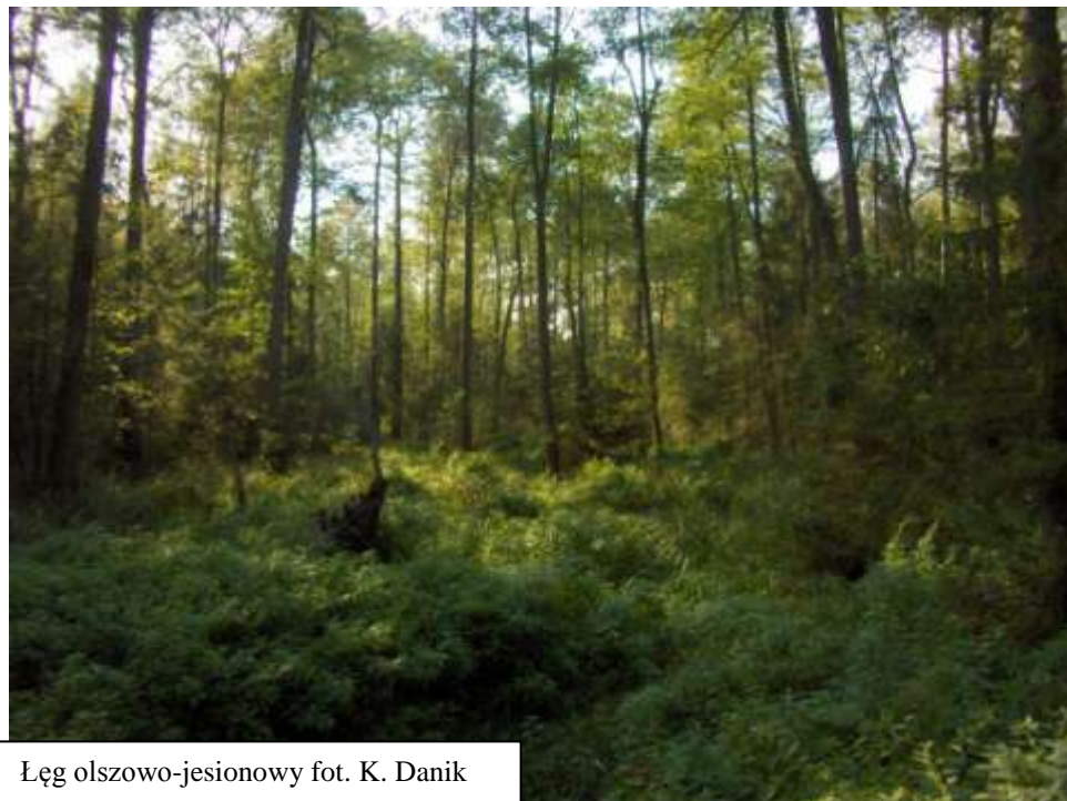
Lęg olszowo-jesionowy

retencję wód i funkcjonowanie korytarzy ekologicznych sieci hydrograficznej. Wszystkie odznaczają się ponadprzeciętnym bogactwem związanej z nimi flory i fauny.