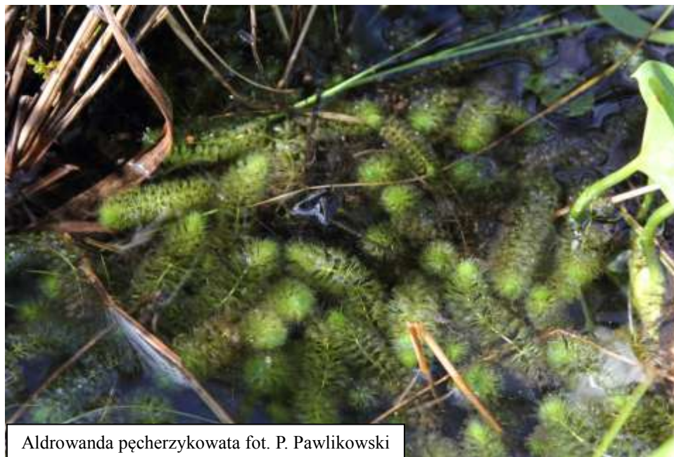
Aldrowanda pęcherzykowata

Mięsożerna, bezkorzeniowa roślina wodna, wolno pływająca tuż pod powierzchnią wody. Pędy koloru zielonego mają długość 6 – 15 cm (wyjątkowo 50). Łodyga pojedyncza lub z 1-3 pędami bocznymi. Liście zebrane po 6-9 w okółku. Klinowate, do 5-8 mm długie, cienkie liście zbudowane z 3-5 warstw komórek, zakończone sztyldastymi szczecinkami długości 6-8 mm. Pomiedzy szczecinkami znajduje się pułapka, osiagajaca dlugosc 3-7 mm, zlozona z dwuch nerkowatych polówek blaszki liściowej. Kwiaty na szypułkach do 2 cm dlugosci, mają po 5 podłużnie jajowatych działek kielicha i tyleż zielonkawo białych, całobrzegich, jajowatych płatków