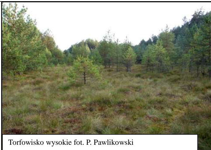
Torfowisko wysokie

Powierzchnia typowego torfowiska wysokiego jest mniej lub bardziej wypukła, przez co w granicach całego torfowiska zaznacza się zróżnicowanie wilgotnościowe i troficzne. W zwykłej płaskiej, najwyżej położonej i najbardziej wilgotnej części kopuły- wierzchowinie- dodatkowo występuje wyraźna mikrorzeźba, w postaci zespołu kęp i dolinek, ze swoistymi zbiorowiskami roślinnymi. Na nachylonych, suchszych zboczach mogą rosnąć drzewa, a na granicy torfowiska i mineralnego otoczenia występuje silnie podtopiony, minerotroficzny okrajek, do którego spływa woda z kopuły oraz terenu otaczającego torfowisko.