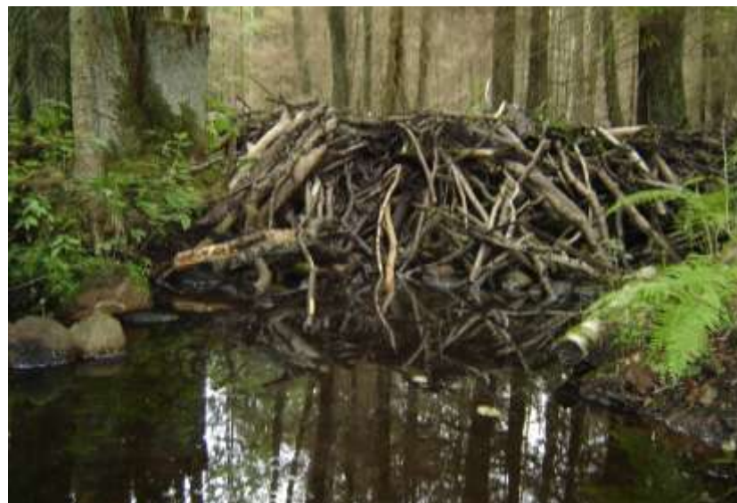
Żeremie bobrowe

Zagrożenia – zagrożeniem może być nadmierna presja turystyczna (zabudowa letniskowa brzegów jezior itp.) oraz rozwój infrastruktury drogowej (rozjeżdżanie migrujących zwierząt).