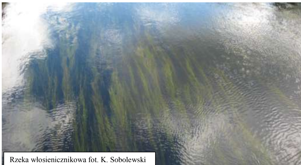
Rzeka włosienicznikowa

Do monitoringu wybrano 68 stanowisk w regionie kontynentalnym i alpejskim, z czego 61 znajduje się w obszarach Natura 2000. Stwierdzono, że na obszarach Natura 2000 monitorowanych w 2011 r. większość (78,5%) badanych obszarów wykazało stan właściwy (FV), a 21,5% stan niezadowolający (U1). Żaden obszar nie wykazał stanu złego (U2).