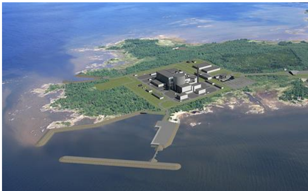
Rysunek 6. Zmodyfikowane zdjęcie lotnicze elektrowni jądrowej na cyplu Hanhikivi.

Budowa elektrowni jądrowej zmieni zagospodarowanie przestrzeni w miejscu jej budowy oraz w okolicy. Domki letniskowe na zachodnim brzegu zostaną usunięte i nie będzie już można wykorzystywać zachodniego brzegu do celów rekreacyjnych. Nowe połączenie drogowe, planowane dla elektrowni jądrowej, nie spowoduje żadnych znaczących zmian w zagospodarowaniu przestrzennym obszaru. Rysunek 6 to zmodyfikowane zdjęcie lotnicze, pokazujące przyszły wygląd elektrowni jądrowej na cyplu Hanhikivi.