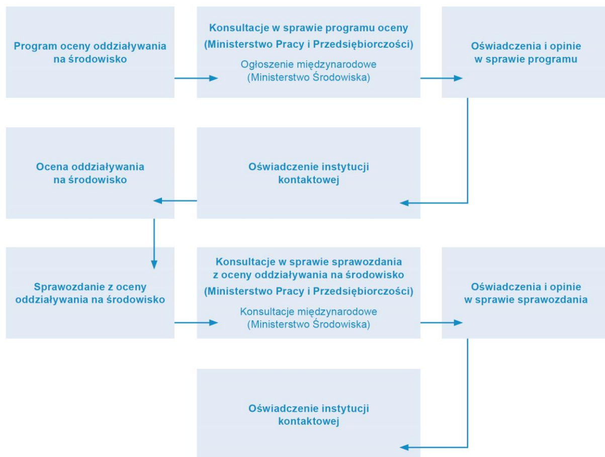
Rysunek 3. Fazy procedury OOŚ.

Fazy procedury OOŚ przedstawia rysunek 3.