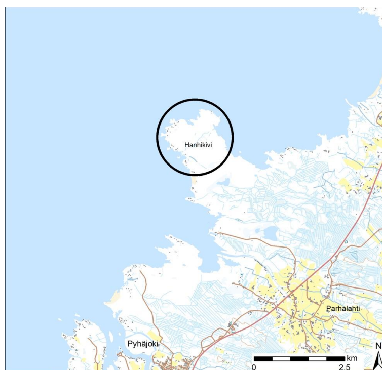
Rysunek 5. Lokalizacja elektrowni jądrowej w obszarze cypla Hanhikivi.

Miejsce projektu znajduje się w Północnej Ostrobotni na zachodnim wybrzeżu Finlandii, na cyplu Hanhikivi w gminach Pyhäjoki i Raahe (Rysunek 5). Regionalny plan zagospodarowania przestrzennego cypla Hanhikivi dotyczący energetyki jądrowej, częściowe plany ogólne elektrowni jądrowej w obszarach Pyhäjoki i Raahe oraz miejscowe szczegółowe plany elektrowni jądrowej w Pyhäjoki i Raahe zostały zatwierdzone dla obszaru cypla Hanhikivi.