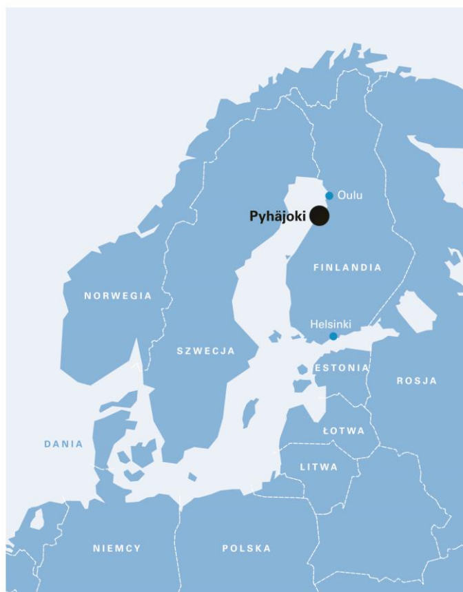
Rysunek 1. Lokalizacja projektu i kraje w regionie Morza Bałtyckiego, z Norwegią włącznie.

Fennovoima otrzymała decyzję ogólną zgodnie z częścią 11 ustawy o energetyce jądrowej (990/1987) w dniu 6 maja 2010 r. Parlament zatwierdził decyzję ogólną w dniu 1 lipca 2010 r. Cypel Hanhikivi w gminie Pyhäjoki został wybrany jako lokalizacja elektrowni jesienią roku 2011 (Rysunek 1).